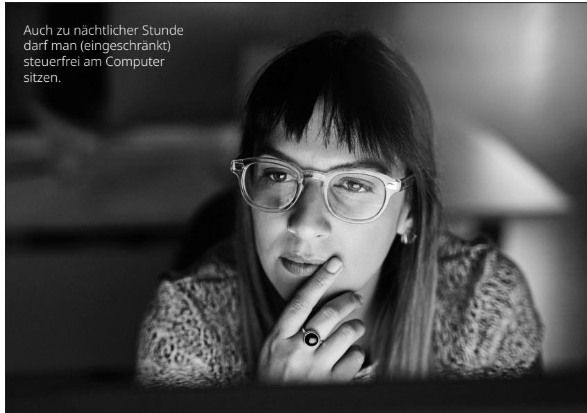
Auch zu nächtlicher Stunde darf man (eingeschränkt) steuerfrei am Computer sitzen.