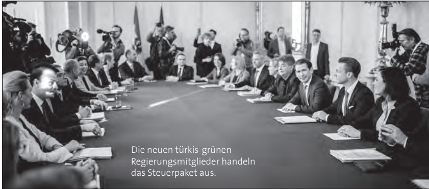
Die neuen türkis-grünen Regierungsglieder handeln das Steuerpaket aus.