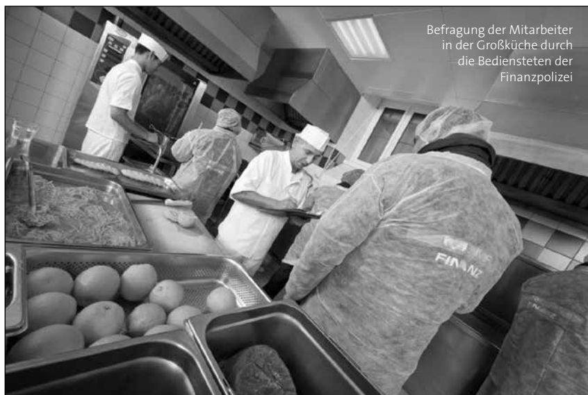
Befragung der Mitarbeiter in der Großküche durch die Bediensteten der Finanzpolizei